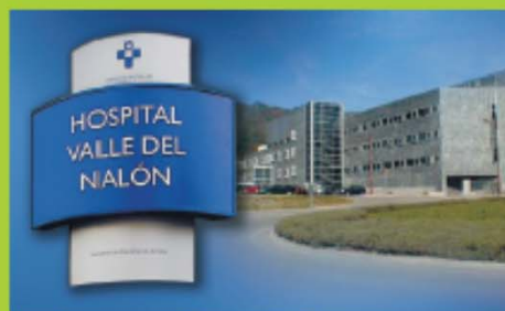
HOSPITAL VALLE DEL NALÓN Poligono de Riaño, s/n - Langreo Telf. 985 65 20 00