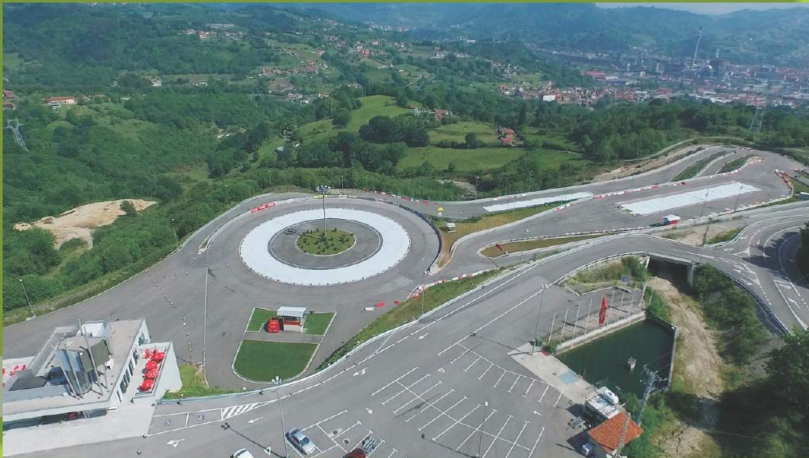
VISTA GENERAL DE TRES DE LAS ZONAS DE ENTRENAMIENTO