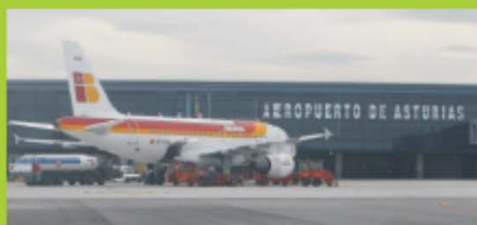
AEROPUERTO DE ASTURIAS Santiago del Monte - Castrillon Telf. 985 12 75 00